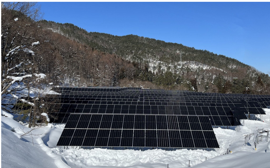
▲コーポレートPPA先の一つ長野県田上市の太陽光発電所（発電事業者：スマートブルー株式会社）